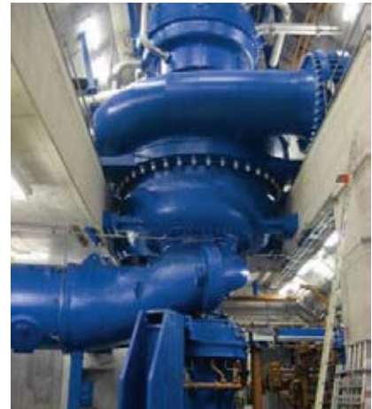
Voith Hydro lieferte für das Kopswerk II Pumpen, Wandler, Kugelschieber und Drosselklappen.

Moderne Stromnetze mit ihrem schnell wachsenden Anteil an Windenergie verdanken ihre Stabilität maßgeblich Pumpspeicherkraftwerken wie dem Kopswerk II. Wind weht nicht gleichmäßig. Bei starkem Wind dienen Pumpspeicherkraftwerke als Speichermedi-