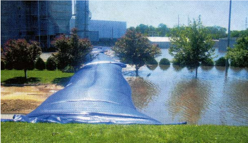
Ein mobiler Hochwasserschutz aus Polyestermembran bewahrt ein Stromkraftwerk vor Wassermassen. Er ist 455 Meter lang, die Wasserhöhe ging bis 1,83 Meter.

nahmen oder Vorbereitungen des Untergrundes erforderlich. Ebenso wichtig ist, dass vier Personen das komplette System errichten können. Im Katastropheneinsatz