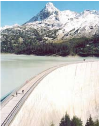
Der Kops-Stausee im österreichischen Vorarlberg.

Am 15. Mai wurde im österreichischen Vorarlberg das weltweit modernste Pumpspeicherkraftwerk eingeweiht: Kopswerk II. Rund 400 Mio. Euro hat der Betreiber, die Vorarlberger Illwerke AG, in dieses Zukunftsprojekt investiert. Nach einer Bauzeit von vier Jahren ist das Kraftwerk bereits seit Ende 2008 erfolgreich am Netz. Maßgebliche Komponenten für das Kopswerk II wurden von Voith Hydro geliefert. Das Heidenheimer Unternehmen ist weltweit führend in Pumpspeichertechnologie.